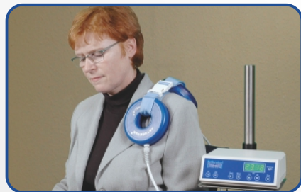
Behandlung der Schulter, des Schultergelenkes

Die durchflutende Behandlung erzielt ihre optimale Wirkung durch anlegen und fixieren einer dunklen und einer hellen Seite der Vitalisierungseinheiten an dem zu behandelnden Körperteil. Die Kleidung muss bei den Behandlungen nicht abgelegt werden.